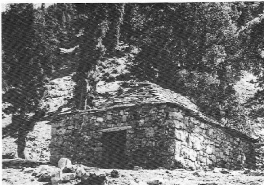
Κοσίνα. "Αη Γιάννης. Έρημοκλήσι.

τησα διαβάτες· έρχονται άπ' τό Θέρμο καί πάνε στην Κόπραϊνα , τό πίσω μέρος άπ' τή ράχη τής Κοσίνας . Καί τότε έμαθα κι άλλη δημοσιά για τά όρεινά τής Εύρυτανίας άπ' τά Κατώμερα , τούτη τής Κόπραϊνας , τής Κοσίνας .