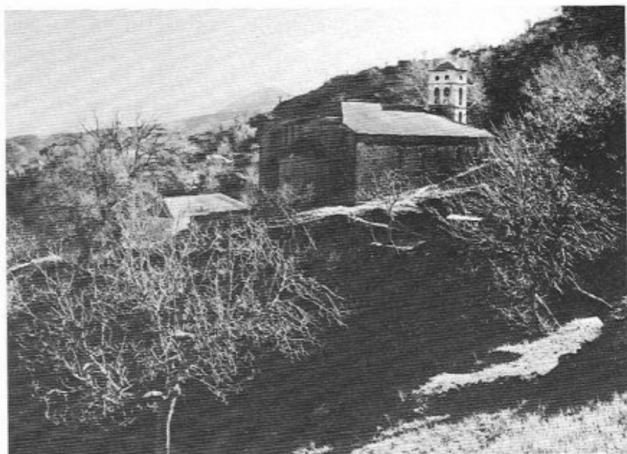
Κόνισκα. Ἡ ἐκκλησία.