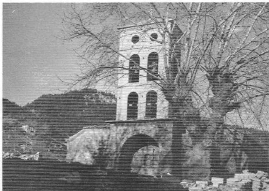
Κόνισκα. Τό καμpanariό.

«Δέσις τοῦ δούλου τοῦ Θεοῦ Ἁθαν. Παπαῖωάννου 1819, 7βρίου 7».