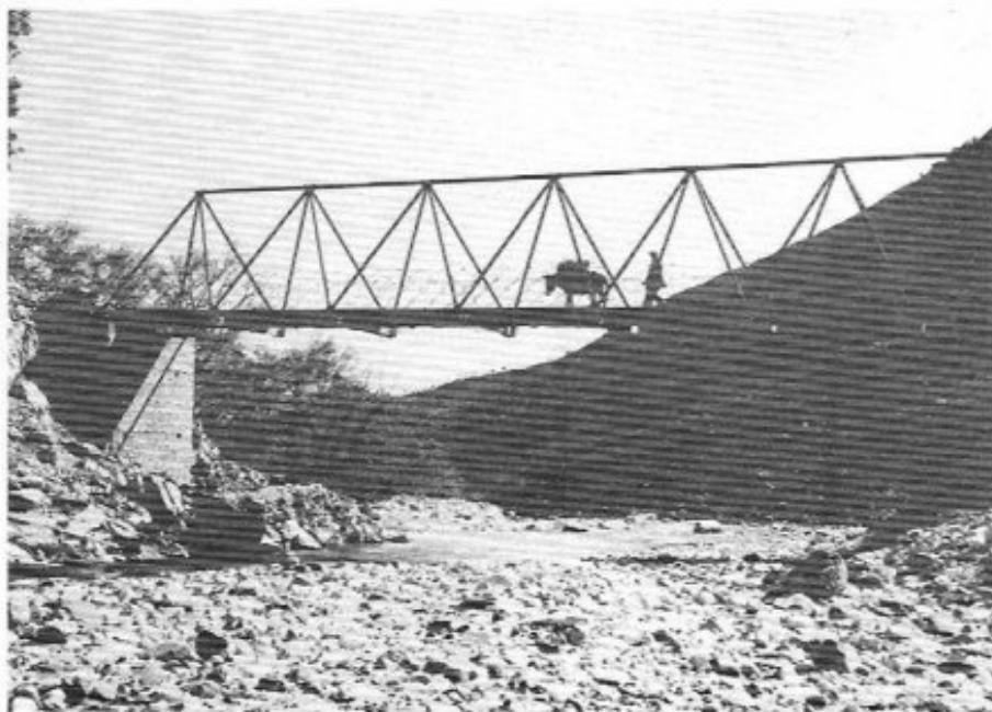
Κόνισκα. Σιδερένιο γεφύρι.