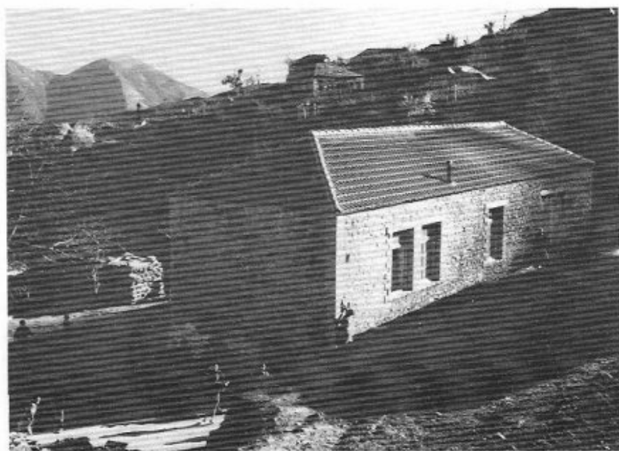
Κόνισκα. Δημοτικό Σχολεῖο.