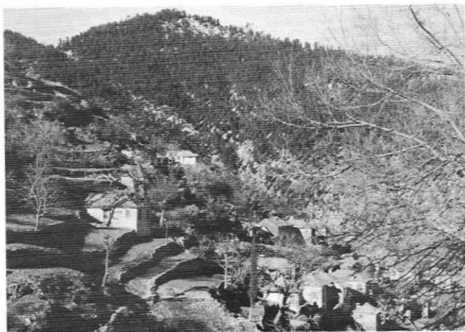
Κόνισκα. Μερικὴ ἀποψη.

ὅσο ἡ Κόνισκα. Γιὰ νὰ πᾶς ἀπ' τ' Ἀμπέλια, πρέπει νὰ ἐξομολογηθῆς πρῶτα, θά σοῦ κοποῦν τὰ ἥπατα ἀπ' τὴν ἀνηφορία· ἂν εἶσαι καί γέρος, μπορεῖ νὰ πάθης καί συγκοπή. Θά κατέβης ἀπ' τ' Ἀμπέλια στό Μαχαλιώτη κι ἔπειτα θά ἀκολουθήσης μονοπάτι πού πάει ἀνάμεσα σ' ὀρθόκοφτα βράχια καί πουρναροφωλιές. Ὑπομονή χρειάζεται καί πρό πάντων ἐπιμονή γιὰ νὰ περάσης μιά ὥρα ἀνήφορο, καί τέτοιον ἀνήφορο! Τέλος πάντων θά πεταχτῆς μέσα ἐκεῖ πού τό λένε στούς Ἀναργύρους, ἓνα ἐξωκκλήσι μισή πάνω κάτω ὥρα δῶθε ἀπ' τὴν Κόνισκα. Ἐκεῖ συναντᾶς καί τό δρόμο πῶρχεται ἀπ' τὰ κατώμερα τοῦ Θέρμου, τόν παίρνεις καί ἰσιάζεις πιά γιὰ τό χωριό. Ἀριστερά καί πάνου σου ἔχεις τόν Ἄνινο 96 , βουνοκορφὴ ἀπ' τίς ψηλότερες.