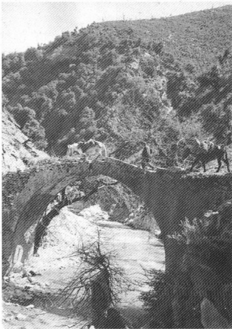
Κόνισκα. Παλιό πέτρινο γεφύρι.