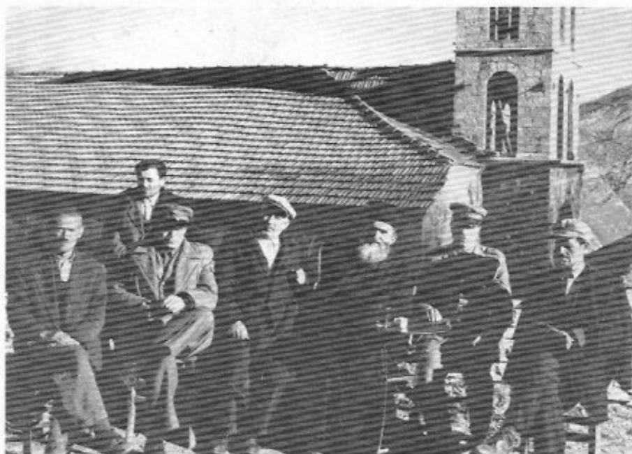
Κόνισκα. Μπρός στο καφενείο.